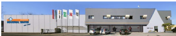
Siège italien - Altavilla Vicentina (Vicenza)

Sosnowiec, Polska Phone. : +48 32 260 0026 www.industrialstarter.com - biuro@industrialstarter.pl