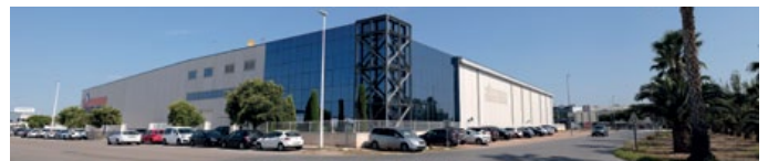
Siège Espagne - Valencia