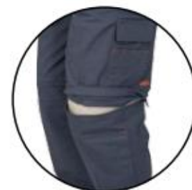
Cremallera, para transformar en bermuda.